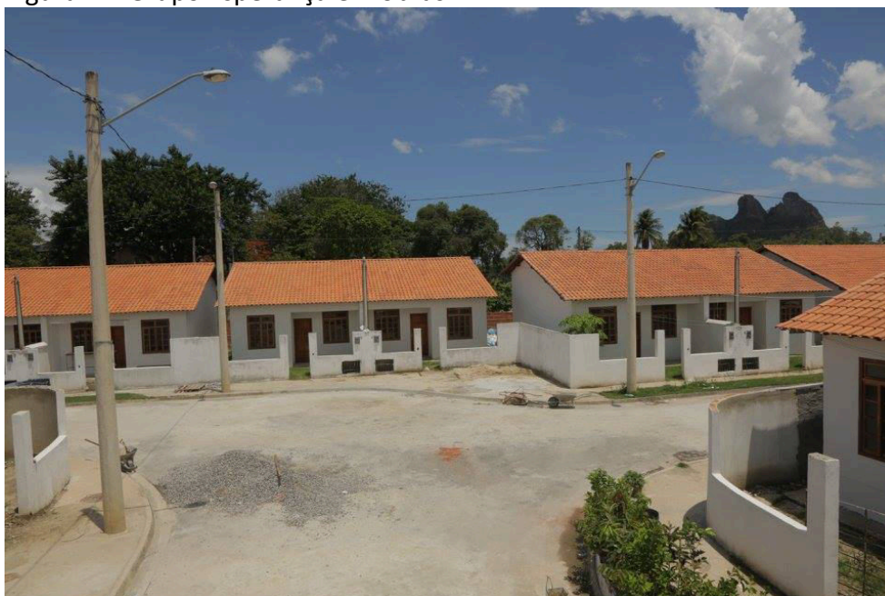
Figura 2 – Grupo Esperança em obras